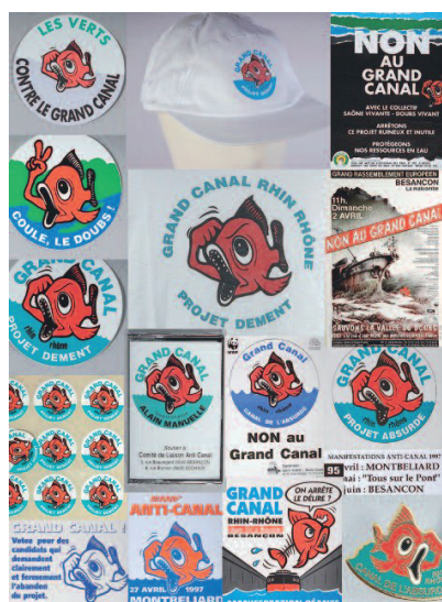
Affiche du CLAC 1975

= « Le canal Rhin-Rhône est un très beau spécimen de sédimentation des discours et de glaciation des décisions. »