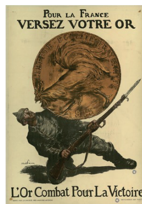
La célèbre affiche d'Albert Faivre (emprunt 1915)

Cette mobilisation générale peut être nommée propagande. Mais ne représente-t-elle pas aussi une manifestation de l'intérêt public ? La frontière entre les deux notions reste ténue. Si la propagande a été relayée partout par les élus, les banques et institutions de crédit, les établissements scolaires ou encore les syndicats professionnels, alors que nul ne s'y trouvait contraint, c'est bien parce que, au-delà des clivages politiques, l'intérêt public justifiait l'effort national.